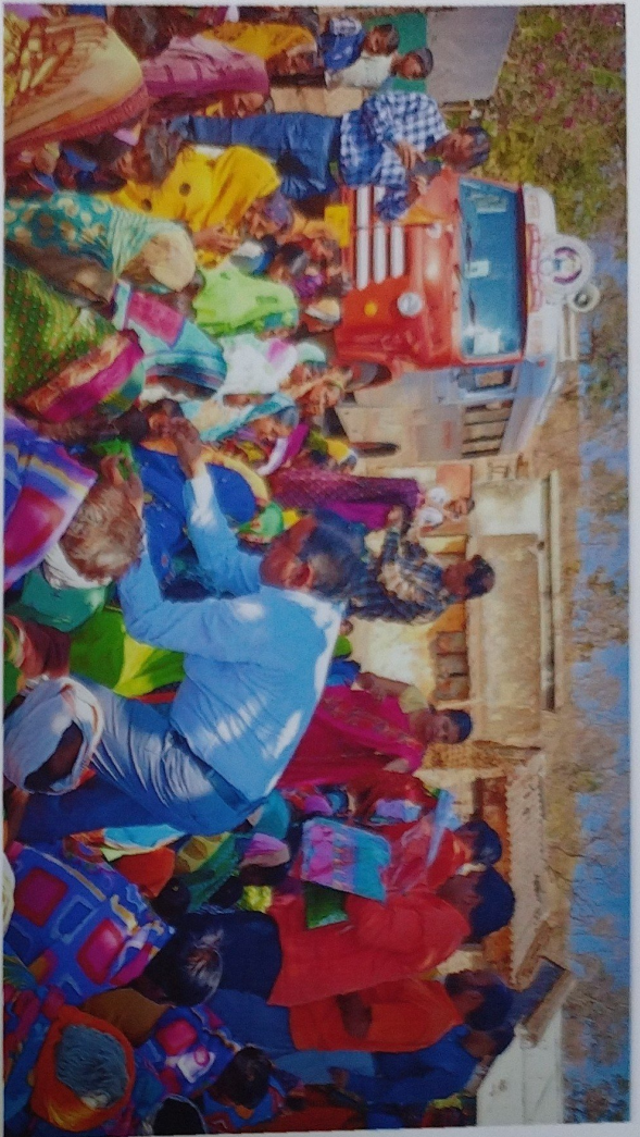
Distribution of Clothing and Blankets to Tribal peoples

at Bela Village at Melghat Forest, District Amravati,