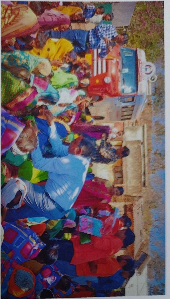
Distribution of Clothing and Blankets to Tribal peoples at Bela Village at Melghat Forest, District Amravati, M.S. 29 th Feb. 2023.