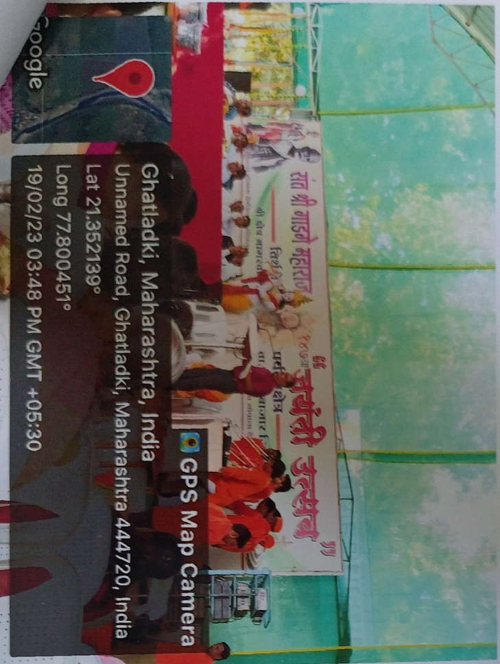
Distribution of Utensils to tribal students at Sant Gadgebaba Ashram School at Nagarwadi, Dist. Amravati M.S. 19 th Feb 2023