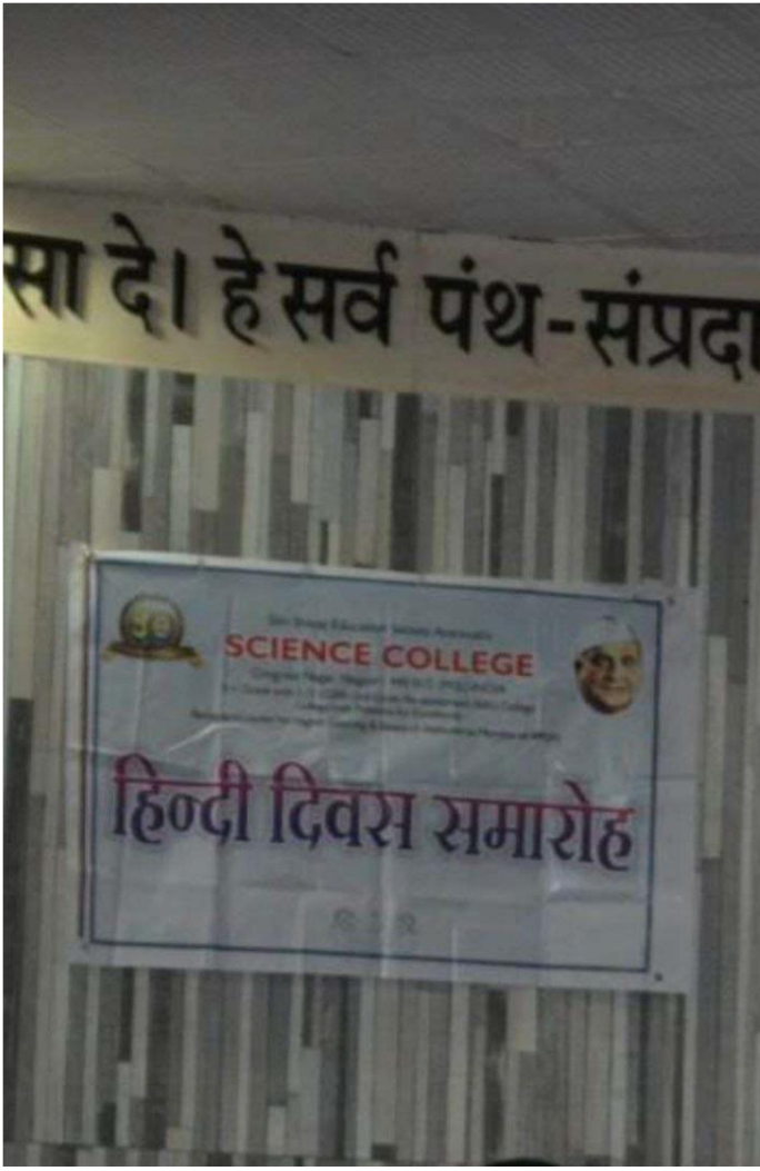
'Hindi Diwas Samaroh' Poster

संस्कृत की एक लाड़ली बेटी है ये हिन्दी, बहनों को साथ लेकर चलती है ये हिन्दी, सुंदर है, मनोरम है, मीठी है, सरल है, ओजस्विनी है और अनूठी है ये हिन्दी, पाथेय है, प्रवास में, परिचय का सूत्र है, मैत्री को जोड़ने की सांकल है ये हिन्दी, पढ़ने व पढ़ाने में सहज है सुगम है, साहित्य का असीम सागर है ये हिन्दी, तुलसी, कबीर, मीरा ने इसमें ही लिखा है, कवि सूर के सागर की गागर है ये हिन्दी, वागेश्वरी के माथे पर वरदहस्त है, निश्चय ही वंदनीय मां-सम है ये हिंदी, अंग्रेजी से भी इसका कोई बैर नहीं है, उसको भी अपने पन से लुभाती है ये हिन्दी, यूं तो देश में कई भाषाएं और हैं, पर राष्ट्र के माथे की बिंदी है ये हिन्दी।