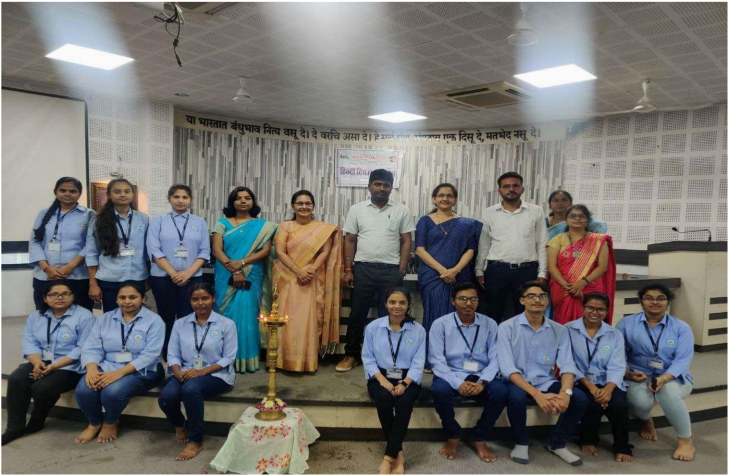
Department of Language and the Students