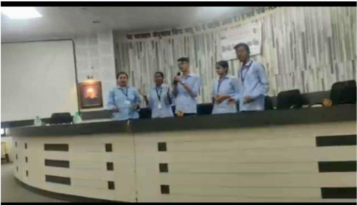
Students Presentation Regarding 'Hindi Diwas'