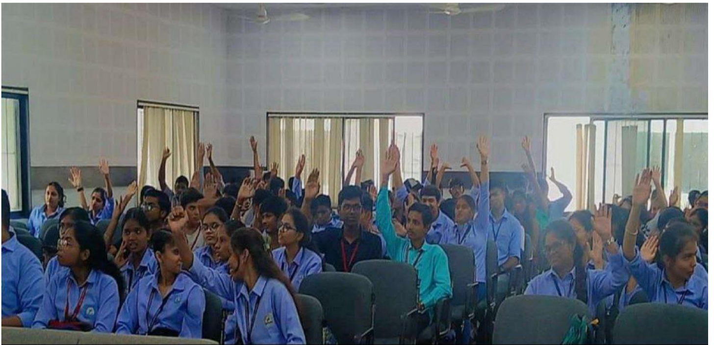
Students Participation in 'Hindi Diwas Samaroh'