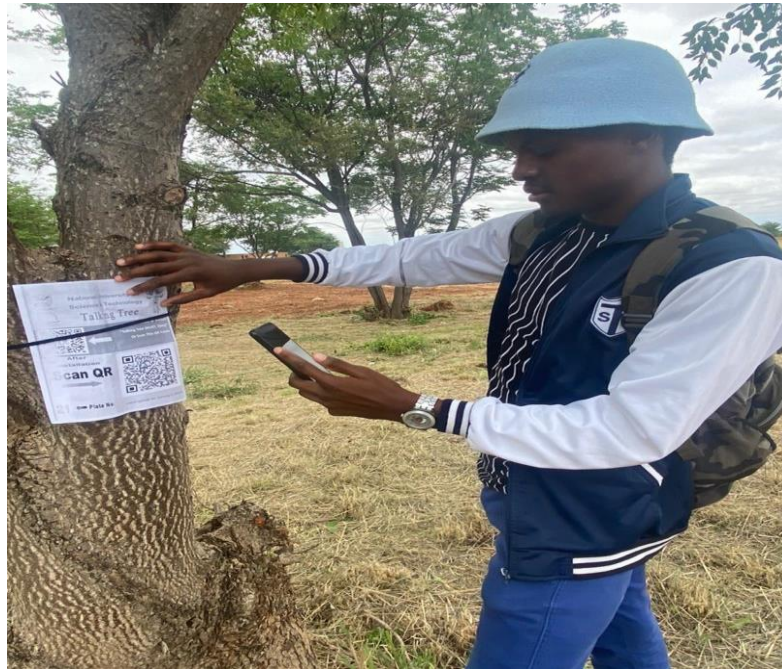
Figure 1 Talking Tree @ NUST Zimbabwe