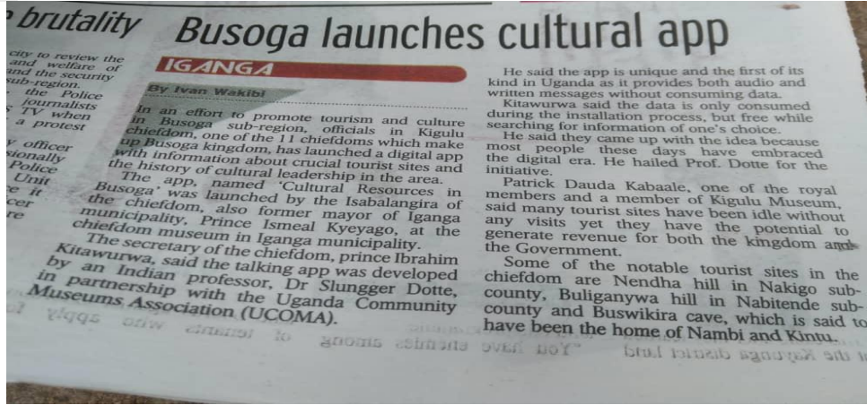
News In Uganda Newspaper

Nagpur First Page No. 1 Sep 26, 2023 Powered by: erelego.com