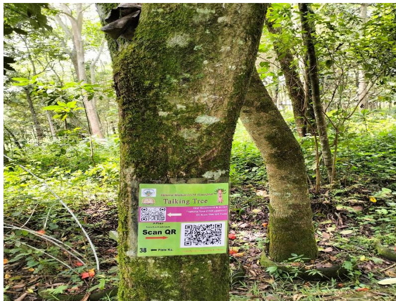
Figure 2: Talking Tree @ Tooro Botanical Garden Uganda