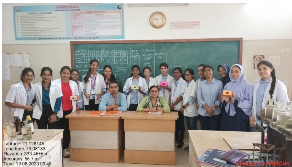
Figure 7- Workshop on Craft Colorimeter