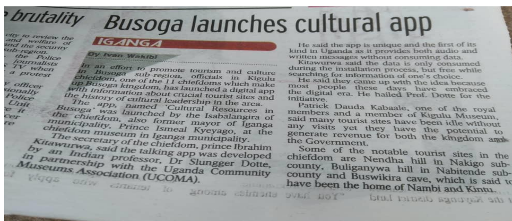
Figure 4- News In Uganda Newspaper