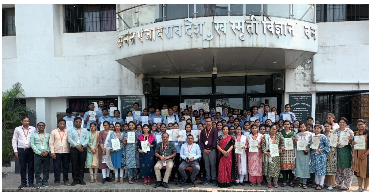
Figure 8- Celebration of 125 IPR

Shivaji Science College has cultivated a culture of protecting intellectual property. In 2023, 100 students received copyright certificates from the Kenyan government, making Shivaji Science College the first institution with more than 150 IPRs, including patent publications, and copyrights from India and Kenya. The college's IPR cell supports students from other institutions, free of charge, resulting in 16 additional students securing their IPRs in 2024.