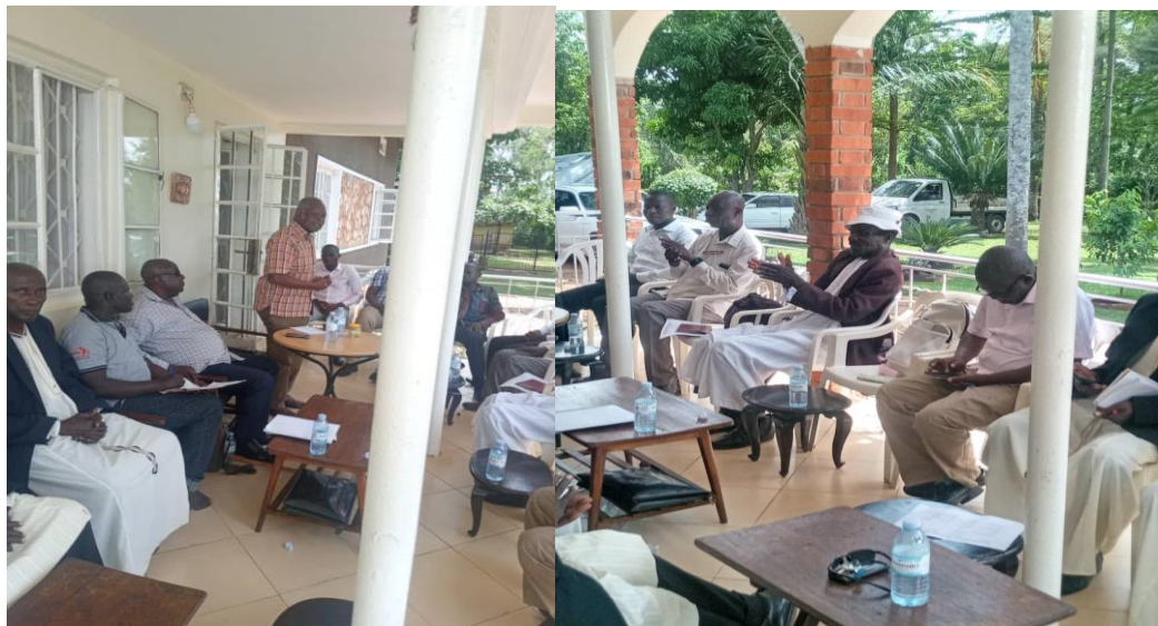
Figure 3-The Hereditary Chiefs of Kigulu Chieftome assembled for the launch @ Uganda